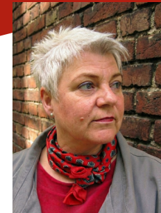
Leitung, Konzeption und Durchführung: SUSANNE LÜFTNER

geb. 1953 in Soest, zwei erwachsene Kinder